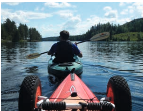
← Paddeltour durch Nordeuropa