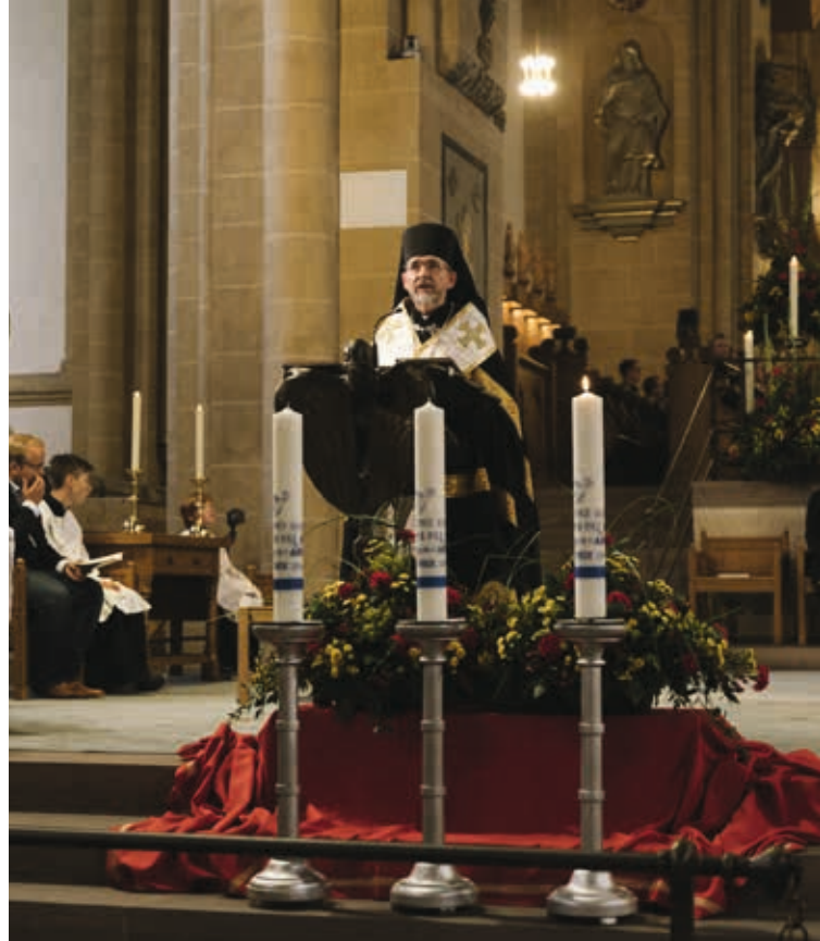
↑ Bischof Bohdan im Paderborner Dom