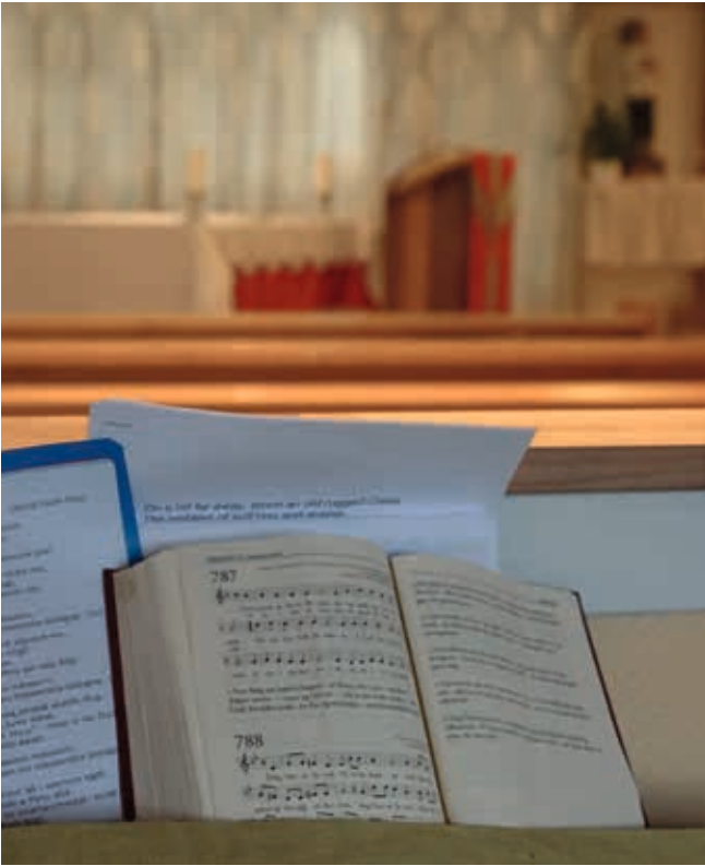
↑ Kapelle St. Lorenzo Ruiz in Björnevatn, Prälatur Tromsø (Finnland)

Verkündigung ist ein Zeugnis-Geben von dem, was einen Christen selbst berührt, bewegt und angesprochen hat.