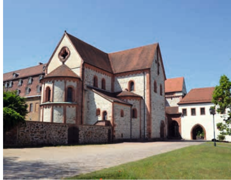
↑ Blick auf Basilika und Klostergebäude in Wechselburg

Meine Taufe 2020 fand in ganz kleinem Rahmen in Wechselburg statt. Vorangegangen waren viele Gespräche, Begegnungen, auch Unsicherheiten – noch mehr Leute, noch mehr Verpflichtung – wollte ich das wirklich? Ich war gerade mittendrin, mir Freiräume