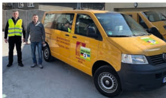
↑ BONI-Bus für ukrainische Gemeinde