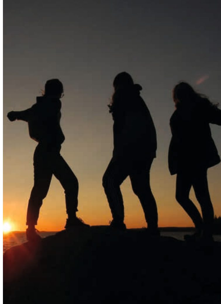
↑ Solnedgång i Marieudd (Sonnenuntergang in Marieudd, Schweden)

Das hat eine inspirierende Strahlkraft! Und eben diese Strahlkraft fruchtbar zu machen, dazu möchte das Leitwort „Entdecke, wer dich stärkt.“ auffordern. Als Einzelne und als Gemeinden sind wir eingeladen, einen neugierigen und staunenden Blick einzunehmen. Ganz bewusst ist die Aufforderung des Leitwortes dabei offen formuliert. Ganz vielfältige und individuelle Dinge können wir als kraftgebende Quellen erkennen,