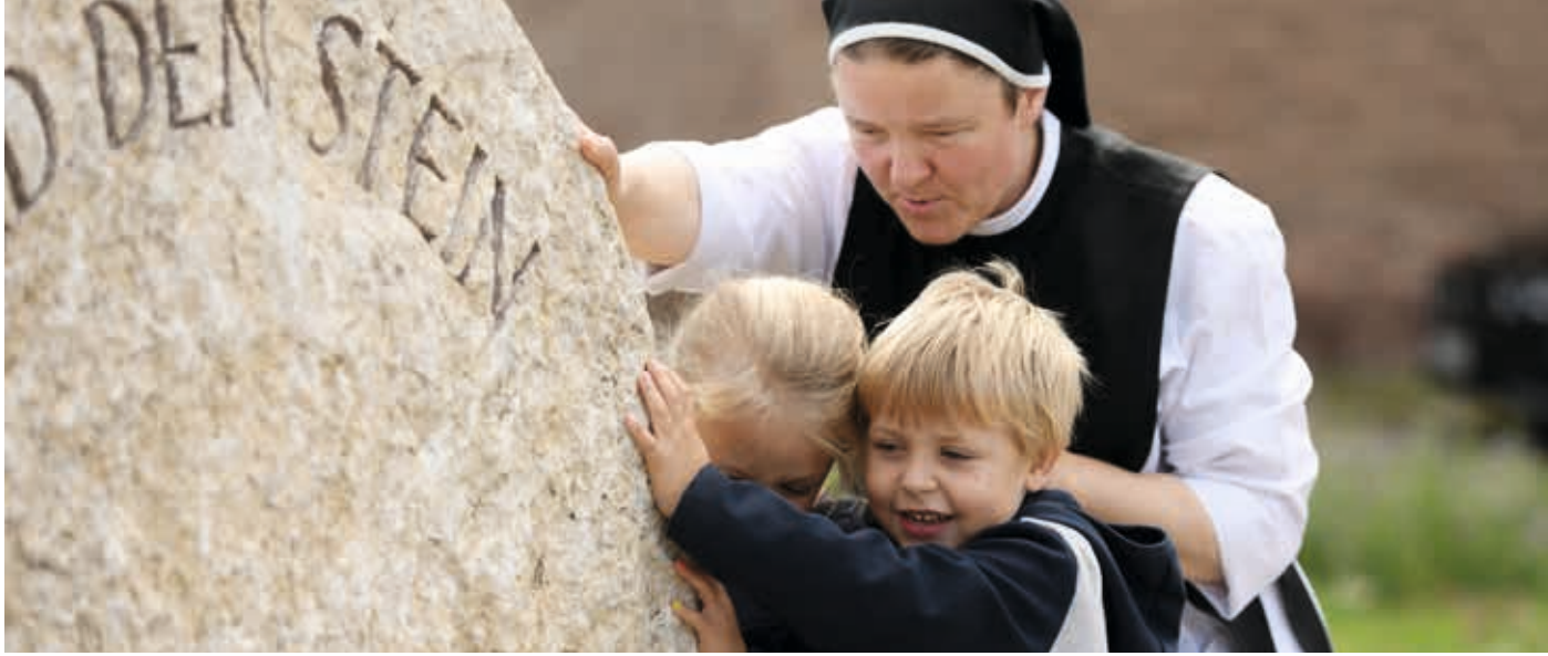
↑ Entdeckungen im Kloster Helfta

Noch deutlicher wird Paulus in seinem Brief an seine Lieblingsgemeinde in Philippi. Einst hatte er sie nach vielen Misserfolgen in Kleinasien als erste Gemeinde auf europäischem Boden zusammen mit der Purpurchandlerin Lydia gegründet. Nun hält er mit ihr Kontakt aus seiner Gefangenschaft, indem er einen Brief an sie schreibt. Wenn man einen traurigen und deprimierten Brief aus der Gefangenschaft erwartet, dann wird man enttäuscht. Dieser kleine Brief ist regelrecht durchtränkt von der Freude des Paulus. Es lohnt sich, einige Verse genauer unter die Lupe zu nehmen: