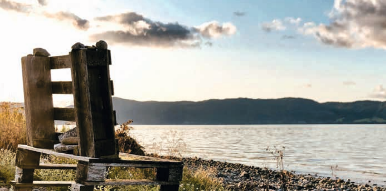
↑ Am Trondheimfjord

der ignatianischen Spiritualität, die ich gerne als „Erkenntnispiritualität“ bezeichne. Was meint das? Ignatius von Loyola (er lebte von 1491 bis 1556) war tief bewegt von der Suche nach Seelenruhe bei Gott. Er machte die Erfahrung, dass weder bestimmte Regeln noch Orte ihn in einen solchen Gotteskontakt bringen, sondern vielmehr innere Stimmigkeit und spürbarer Trost – nicht im Sinne von Befriedigung, sondern von Gelassenheit. In den „Geistlichen Übungen“ hat er einen Weg beschrieben, die eigene Lebenssituation im Nachempfinden des Lebens und der Gottesbeziehung Jesu so zu bereiten und auszurichten, dass diese Erfahrung möglich wird. Es ist eine spirituelle Praxis, in der man nichts Bestimmtes oder Besonderes macht oder sein muss, sondern sich in einer Haltung und Perspektive einübt, die „Gott finden in allen Dingen“ ermöglicht, weil nicht „das Ding“, sondern mein Blick darauf entscheidend ist. Diese Einübung ist nicht trivial, aber gangbar.