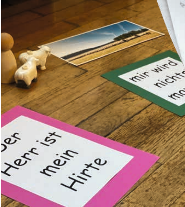
↑ In der Bibel lassen sich Worte für die eigenen Erfahrungen finden