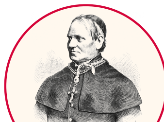
Bischof Konrad Martin-Stiftung

Eine weitere Möglichkeit ist die Zustiftung in eine bestehende rechtsfähige Stiftung. Mit der Bischof Konrad Martin-Stiftung verfügt das Bonifatiuswerk über eine solche Stiftung. Zweck dieser Stiftung ist die nationale und internationale Förderung der Jugendhilfe und Erziehung und Bildung in der katholischen Kirche in den Gebieten der Diaspora Deutschlands, Nordeuropas sowie Estlands und Lettlands.