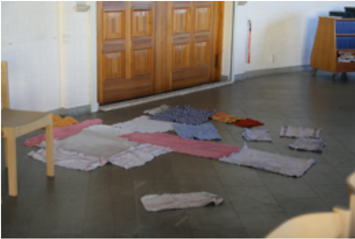
Wasser tropft an verschiedenen Stellen in die Kirche