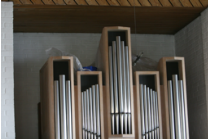
Wasser tropft auf die Orgel