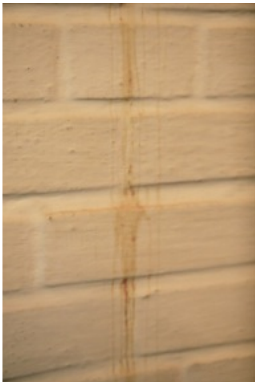
Wasser läuft die Kirchenwände innen herunter