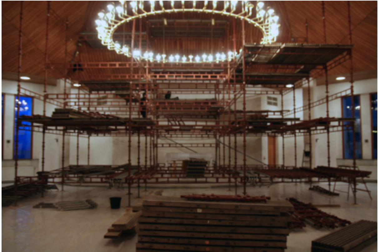
Baugerüst und alt/neu nebeneinander samt der sichtbaren Dampfsperre = Folie