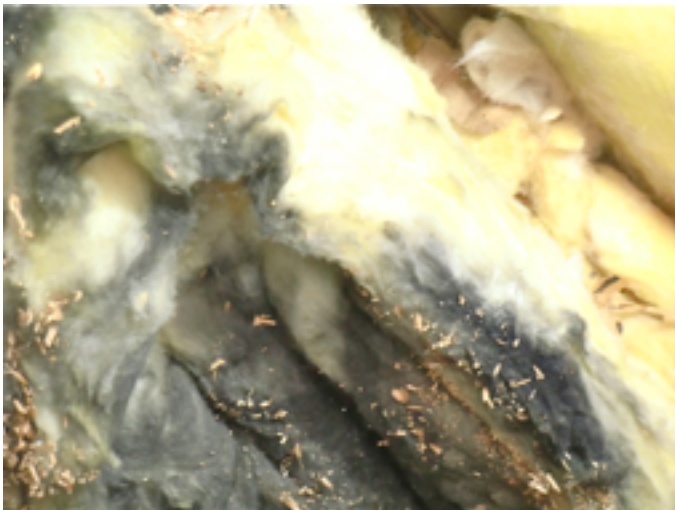
Dämmmaterial auf dem Dachboden beginnt zu schimmeln