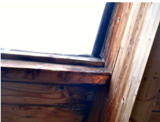
Undichte Fenster im Kirchendach